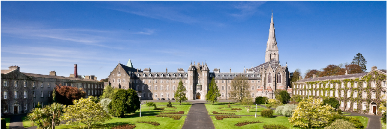
Figure 2: A figure

Sed ut perspiciatis, unde omnis iste natus error sit voluptatem accusantium doloremque laudantium, totam rem aperiam eaque ipsa, quae ab illo inventore veritatis et quasi architecto beatae vitae dicta sunt, explicabo. Nemo enim ipsam voluptatem, quia voluptas sit, aspernatur aut odit aut fugit, sed quia consequuntur magni dolores eos, qui ratione voluptatem sequi nesciunt, neque porro quisquam est, qui dolorem ipsum, quia dolor sit amet consectetur adipisci[ng] velit, sed quia non numquam [do] eius modi tempora inci[di]dunt, ut labore et dolore magnam aliquam quaerat voluptatem. Figure 2 shows individual colour channels.